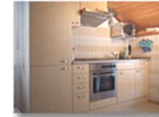
Küchenzeile mit Essecke